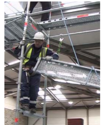
Sécurisation facteur 0