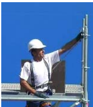
Accrochage en sortie de trappe