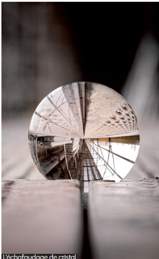
L'échafaudage de cristal